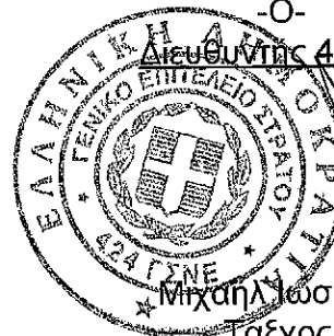
Μιχαήλ Γασηφίδης Ταχός